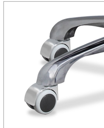
base de aluminio pulida y ruedas cromadas para parquet.