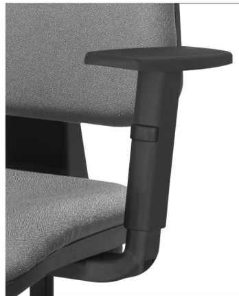
brazo regulable en altura

Opcionalmente con brazos fijos o con brazos regulables en altura. Dos posibles mecanismos de trabajo, 2 palancas con regulación de altura del asiento, inclinación del respaldo y regulación de altura del apoyo lumbar, o 3 palancas con regulación adicional de inclinación del asiento. Ambos mecanismos pueden acoplar el sistema trasla que añade la función de asiento deslizable. Opcionalmente con base de aluminio pulido y topes fijos o ruedas de tipo cromadas o para parquet.