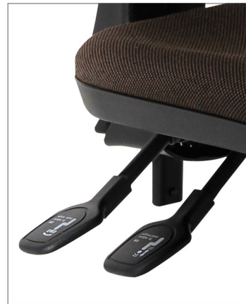
mecanismo 2 o 3 palancas