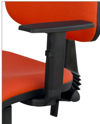
brazo regulable en altura

Opcionalmente con brazos fijos o con brazos regulables en altura. Dos posibles mecanismos de trabajo, 2 palancas con regulación de altura del asiento, inclinación del respaldo y regulación de altura del apoyo lumbar, o 3 palancas con regulación adicional de inclinación del asiento. Ambos mecanismos pueden acoplar el sistema trasla que añade la función de asiento deslizante. Opcionalmente con base de aluminio pulido, aro reposapiés regulable y topes fijos o ruedas de tipo cromadas o para parquet.