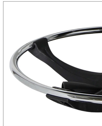
aro reposapiés regulable