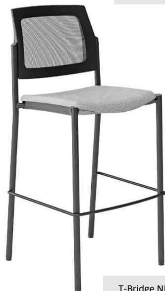
T-Bridge NR M G1 227