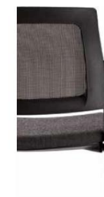
Tapizado con respaldo en malla