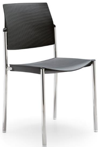
Bridge 00 CR PP NR 133