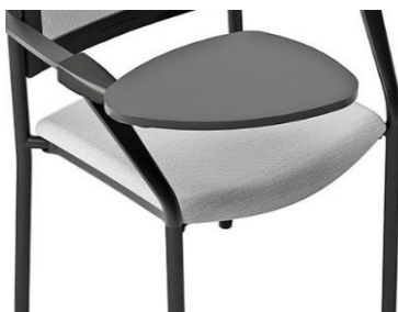
Pala de escritura 66