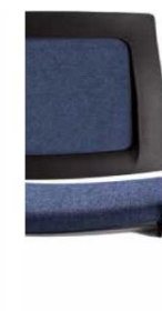
Tapizado con contra tapizado