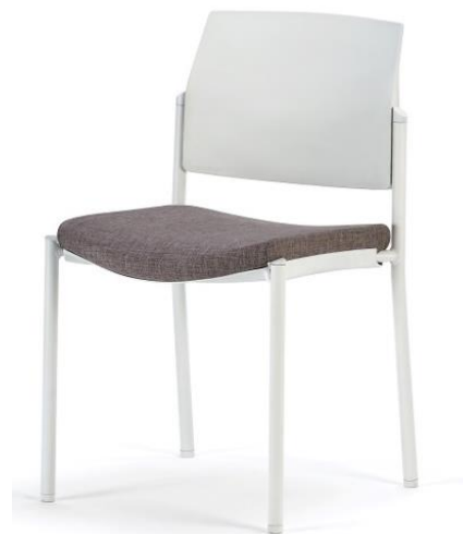
* Bridge 00 BL PP BL As.G1