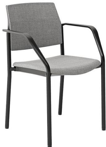
Bridge 01 NR G1 187

"Bridge G" con asiento y respaldo tapizados. Y "Bridge M" con asiento tapizado y respaldo en malla. Estructuras con acabado en epoxi Negro(NR), bien cromadas (CR). Otros acabados a consultar según pedido. Disponibles tacos con fieltro. Apilable máximo 6 unidades.