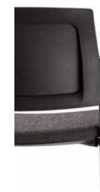
Tapizado con contra de plástico