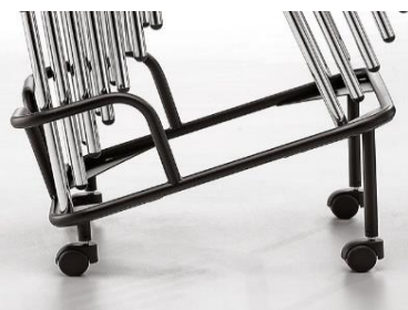
Carro porta-sillas (12un.) 123