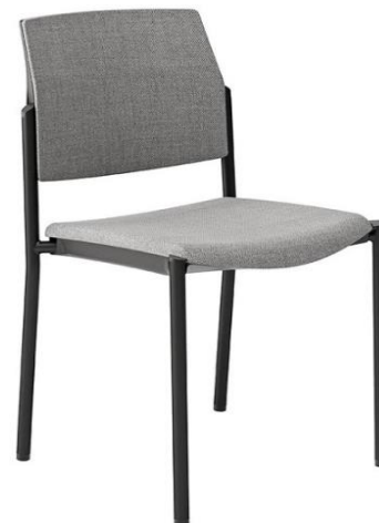
Bridge 00 NR G1 171