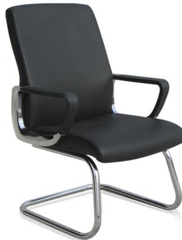
E BP (Piel) Negro 442 Marrón 442