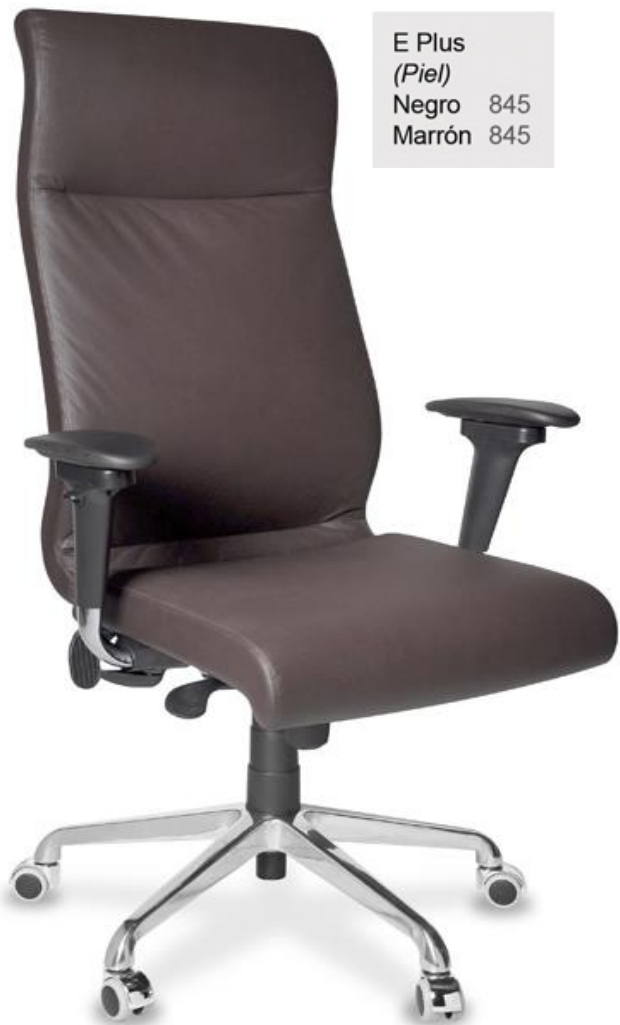
E Plus (Piel) Negro 845 Marrón 845