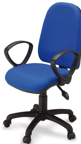
RIAC 3P D