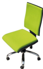
MASK 1 MT