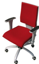
MASK 2 UR - MT - R.Parq.