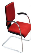
MASK BP CR