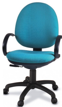
5800 AS Z