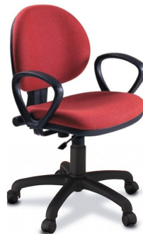
5850 2P D