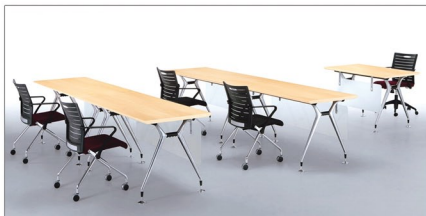
CLH 1 1800