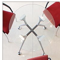
CLH 225 B