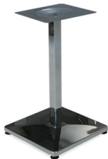
ST 430 Q