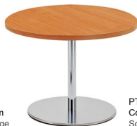
PT 550 CR Columna: 75 x 690 mm Sobre: ML 30 R70 Cerezo