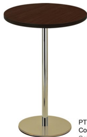
PT 430 NI Columna: 75 x 1060 mm Sobre: ML 30 R60 Wenge