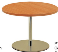
PT 550 NI Columna: 75 x 690 mm Sobre: ML 30 R70 Cerezo