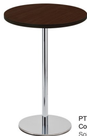
PT 430 CR Columna: 75 x 1060 mm Sobre: ML 30 R60 Wenge