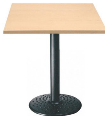
Z 430 NR Columna: 75 x 640 mm Sobre: ML 30 Q70 Natural