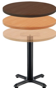
F 560 NR Columna: 75 x 640 mm Sobre: ML 30 R70 N / C / W