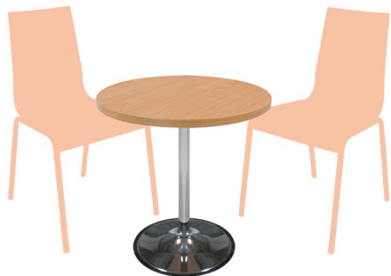
BD 460 CR Columna: 50 x 690 mm Sobre: ML 30 R60 H.Soft