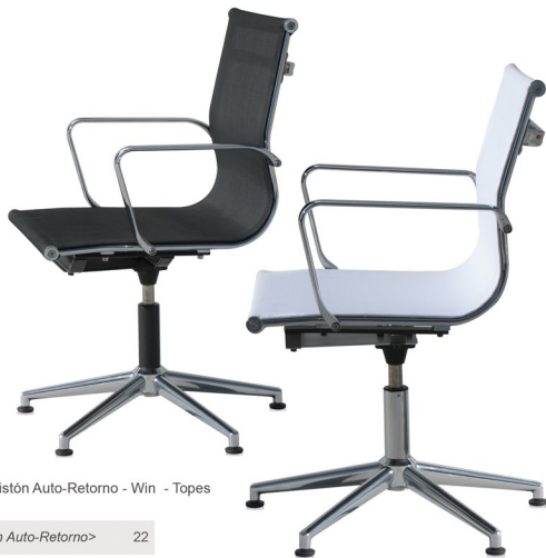
K2 Pistón Auto-Retorno - Win - Topes