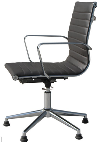
J2 Pistón Auto-Retorno - Win - Topes