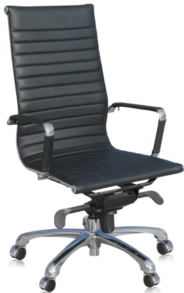
J1 Fundas - R.Crom.