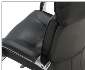
H BP (Piel) Negro 382 Beige 427