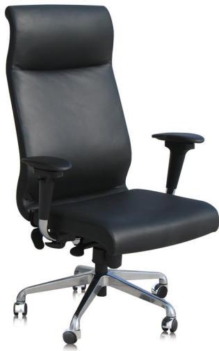
E Plus R.Crom.