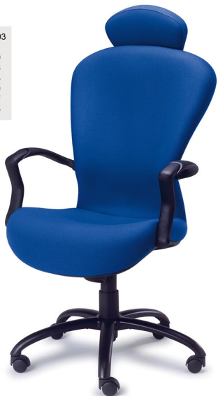
PRISMA 03 AR