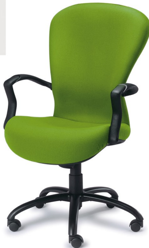
PRISMA 01 AR

Basculación libre con paro en 5 posiciones y sistema Antishock