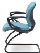
ECLIPSE 4 E