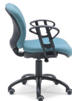
ECLIPSE 2 R - AR - R.Parq.

Basculación libre con paro en 4 posiciones y sistema Antishock