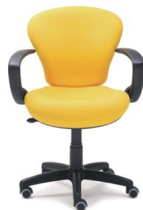
ECLIPSE 2 E - R.Parq.