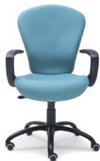
ECLIPSE 1 E - AR - R.Parq.