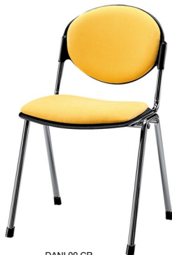
DANI 00 CR (Tapizada)