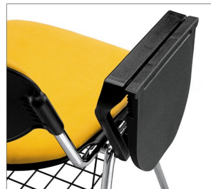
DANI 00 CR Brazo Pala Escritura - Cesto Rejilla (Tapizada)