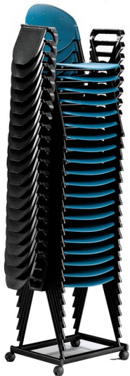
DANI 01 NR Brazo Pala Escritura - Carro Portasillas (Polipropileno)