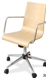
305 CR-F Win (Basculante)