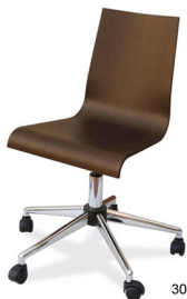
304 CR Win