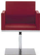
CUBO 05 Base ST + Columna Auto-retorno