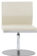
CUBO 04 Base PT + Columna Auto-retorno