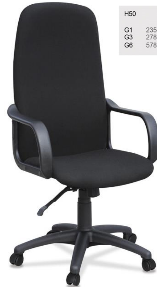
H50 G1 235 G3 278 G6 578