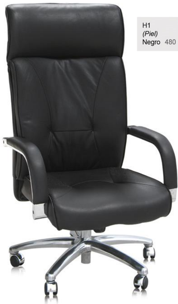
H1 (Piel) Negro 480