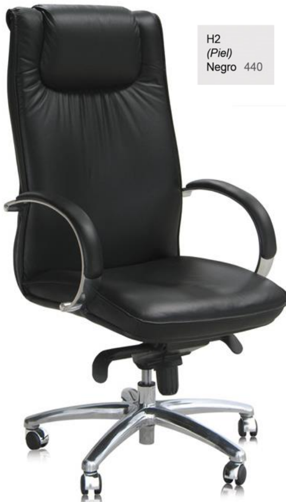
H2 (Piel) Negro 440