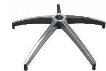
Base Alum.Cromado AREA 0