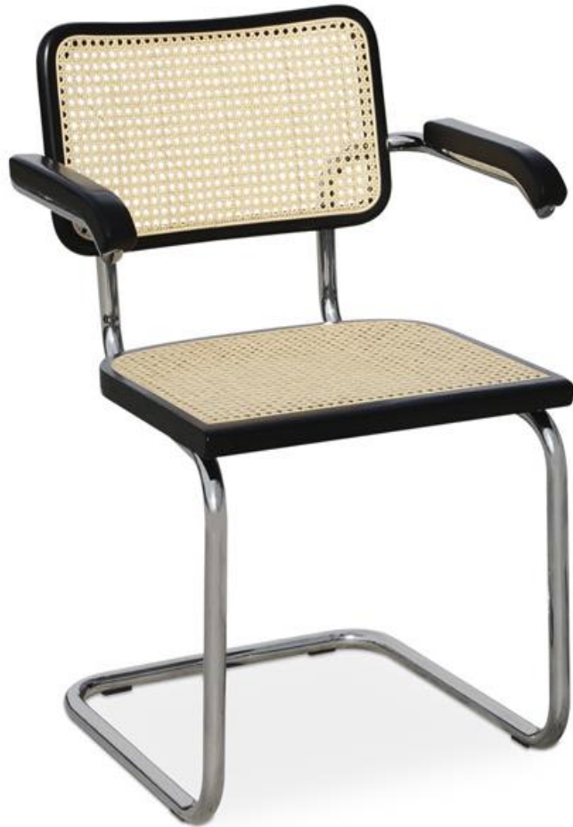
X-11 Lacado Negro