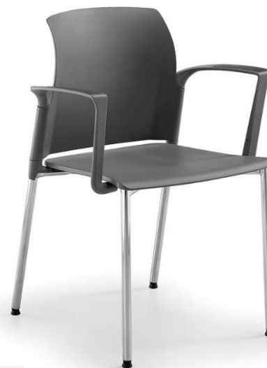
Slim 01 CR gr