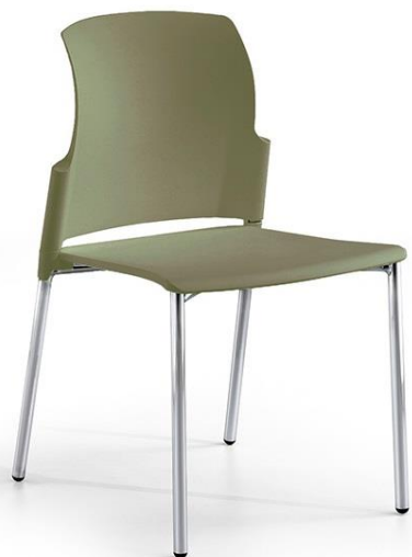
Slim 00 CR vd

Asiento de polipropileno y respaldo de polipropileno reforzado con fibra de vidrio de colores negro, blanco, gris, arena, burdeos o verde. Brazos em polipropileno del mismo color con tapa apoyabrazos integrada de goma. Estructuras fijas pintadas en epoxi Gris (G), Cromada (CR) o pintada Blanco (BL). Estructura giratoria pintada en Gris (G) Disponibles tacos con fieltro para las versiones de 4 patas. Apilable con carro 8 unidades.