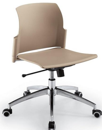
Slim 04 sr