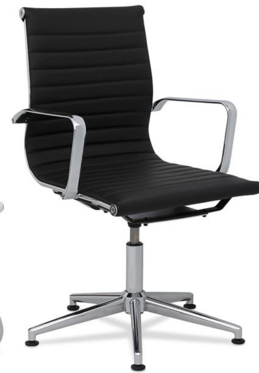
J2 Auto-retorno Topes fijos