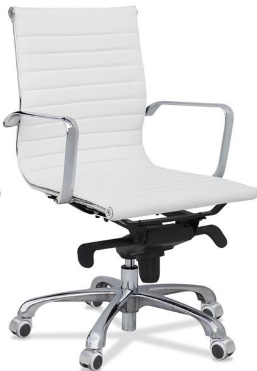
J2 Ruedas Cromadas Parquet