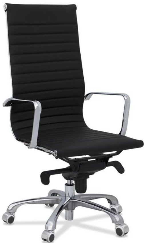
J1 Ruedas Cromadas Parquet