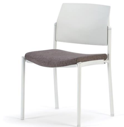
Bridge 00 BL PP BL As.G1 120*