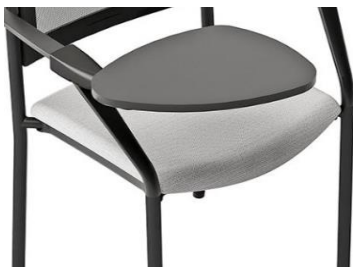
Brazo con pala escritura 57