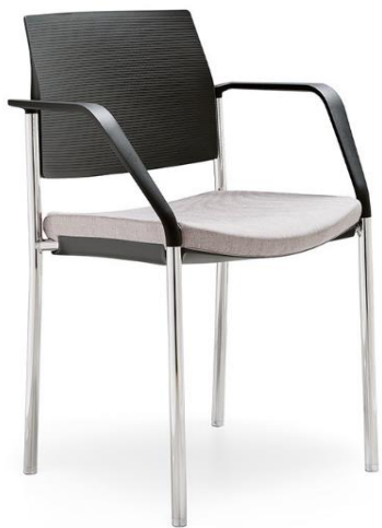
Bridge 01 CR PP NR As.G1 136

"Bridge PP" con asiento de polipropileno y respaldo de polipropileno reforzado con fibra de vidrio de colores negro, blanco, arena o gris antracita. Opcionalmente con asiento tapizable en cualquiera de nuestras telas. Estructuras con acabado en epoxi Negro(NR), bien cromadas (CR). Otros acabados a consultar según pedido. Disponibles tacos con fieltro. Apilable máximo 6 unidades, 12 unidades sin tapizar con carro porta-sillas.