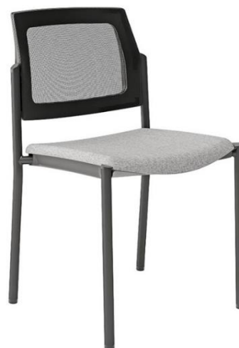
Bridge 00 NR M G1 157