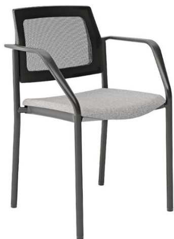
Bridge 01 NR M G1 173