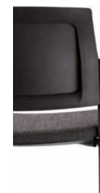
Tapizado con contra de plástico