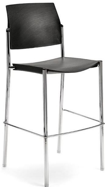
T-Bridge CR PP NR 161