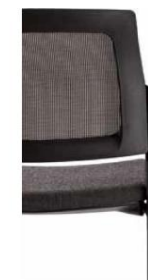
Tapizado con respaldo en malla