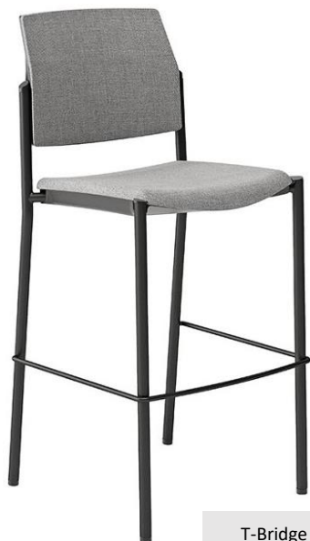
T-Bridge NR G1 196