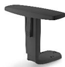
Br. TS 34