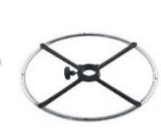
Aro D.46cm 30