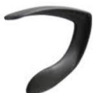
Br. G 39