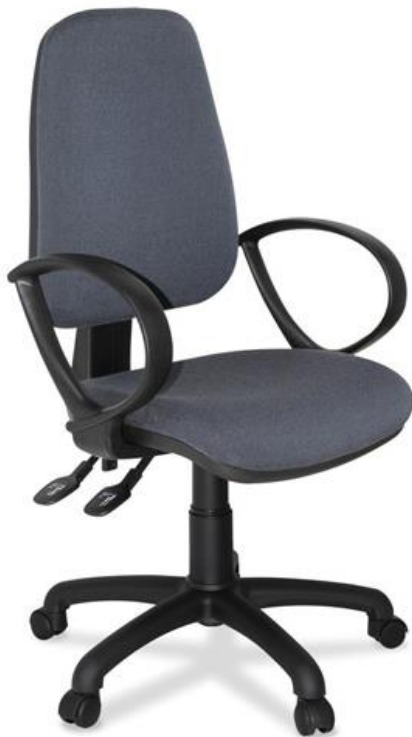
TORINO 2 Palancas - Brazo Flip

*Pistón Taburete Standard **Pistón Taburete Extra Largo