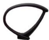
Br. Flip 34