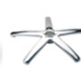
Base ARON 0