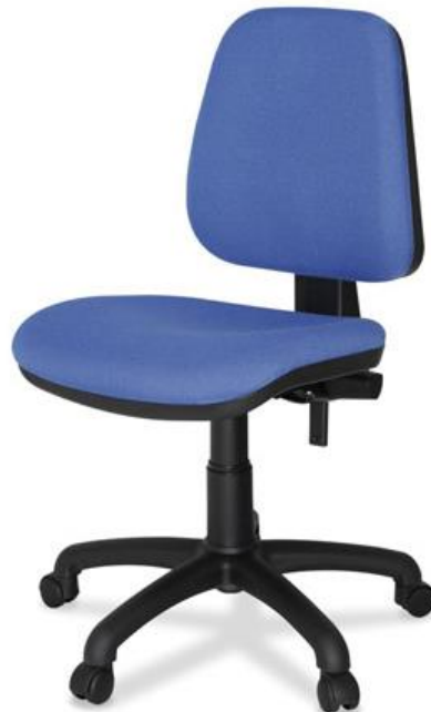
MILAN 2 Palancas