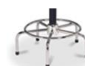
Aro fijo (+8cm) 35