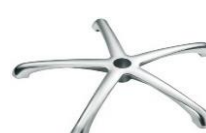
Base Alum. pulido AR32 33