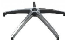
Base Alum. pulido AREA 33