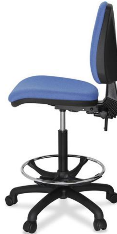
MILAN 2 Palancas - Pistón taburete Standard Aro Reposapiés Regulable