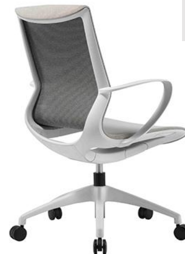
Aeris BL GR 408