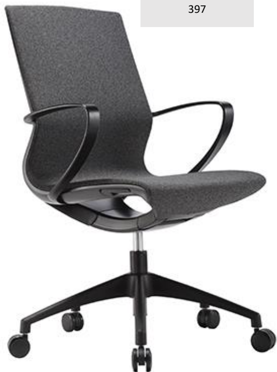
Aeris NR NR 397